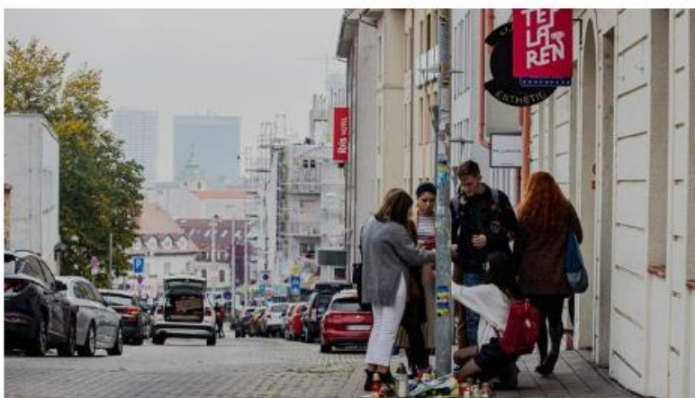
Před gay barem Tepláreň, kde byli zastřeleni dva muži lidé pokládají květiny a zapalují svíčky.

"Necítím žádnou lítost, není to směšné?" napsal na Twitter anonym jen pár minut poté, co ve středu večer v centru Bratislavy někdo střelil před barem Tepláreň. K útoku se pak mladík přihlásil na sociálních sítích. Zabil dva muže a zranil jednu ženu, svůj čin zdůvodnil v neonacistickém manifestu. Ve čtvrtek ráno slovenská policie našla jeho tělo.